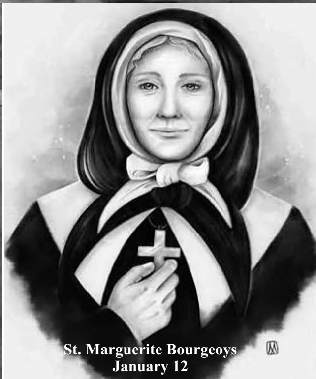
St. Marguerite Bourgeoys January 12