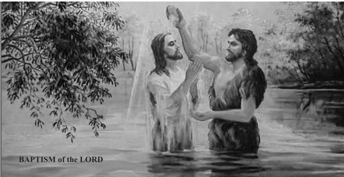
BAPTISM of the LORD