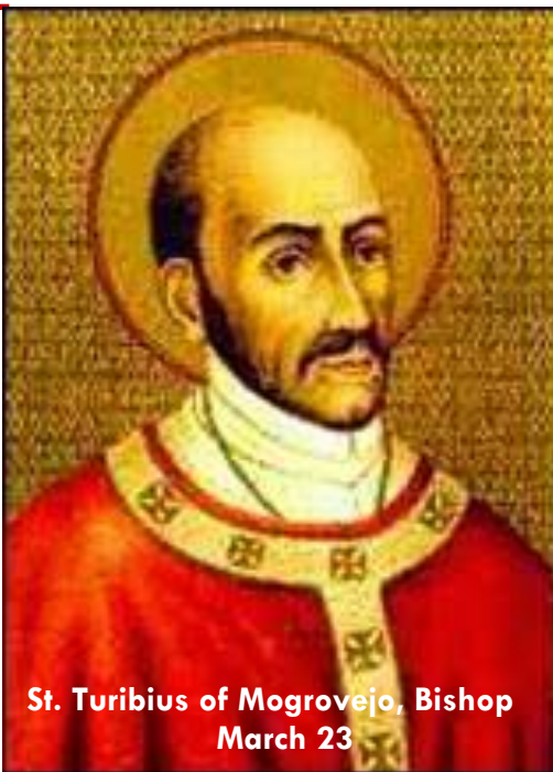
St. Turibius of Mogrovejo, Bishop March 23