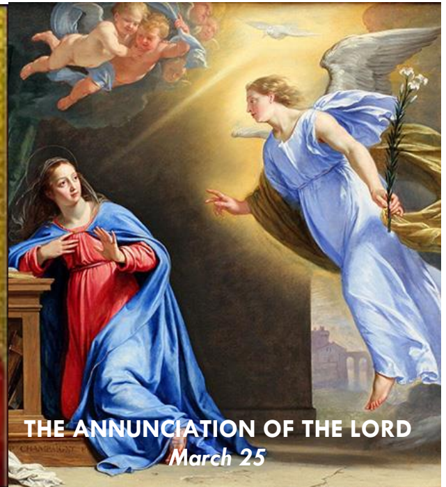
THE ANNUNCIATION OF THE LORD March 25

STATIONS of the CROSS: every Friday during Lent after the 6PM Mass.