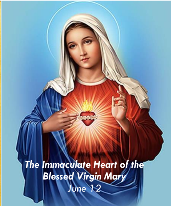
The Immaculate Heart of the Blessed Virgin Mary June 12